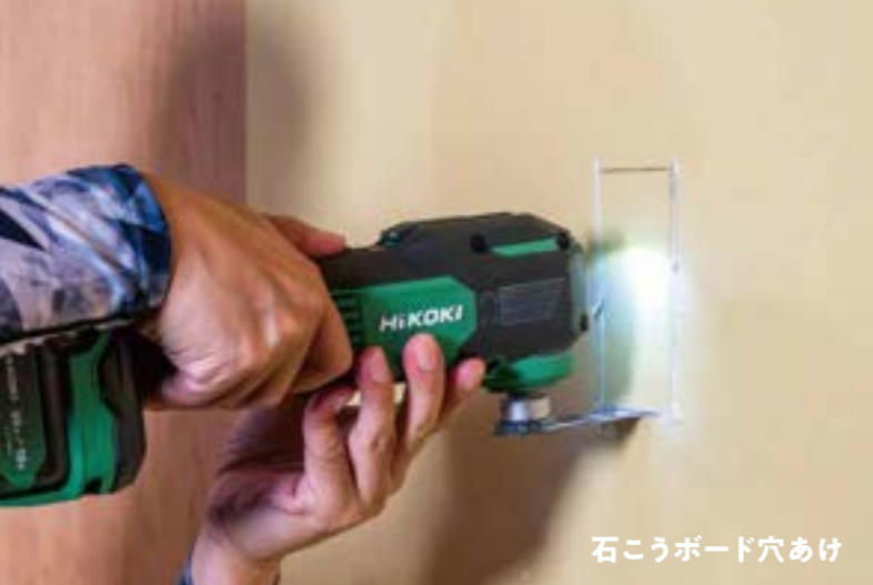
石こうボード穴あけ