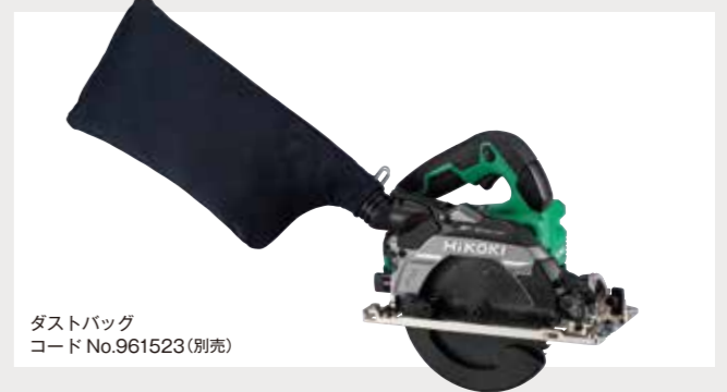
ダストバッグ コードNo.961523(別売)

切粉排出経路の見直しとダストアダプタ取付部の構造変更により集じん性能が大幅にアップしました。これによりダストバッグでも高効率な自己集じんが可能になりました。