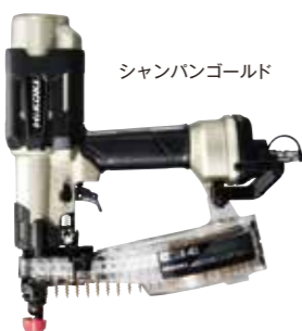
シャンパンゴールド