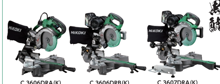
C 3606DRA (K) C 3606DRB (K) C 3607DRA (K)