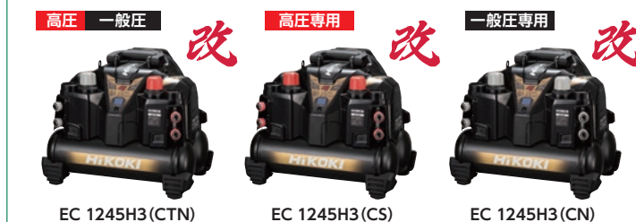
EC 1245H3 (CTN) EC 1245H3 (CS) EC 1245H3 (CN)