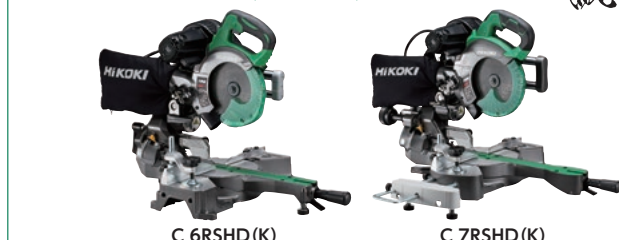
C 6RSHD (K) C 7RSHD (K)